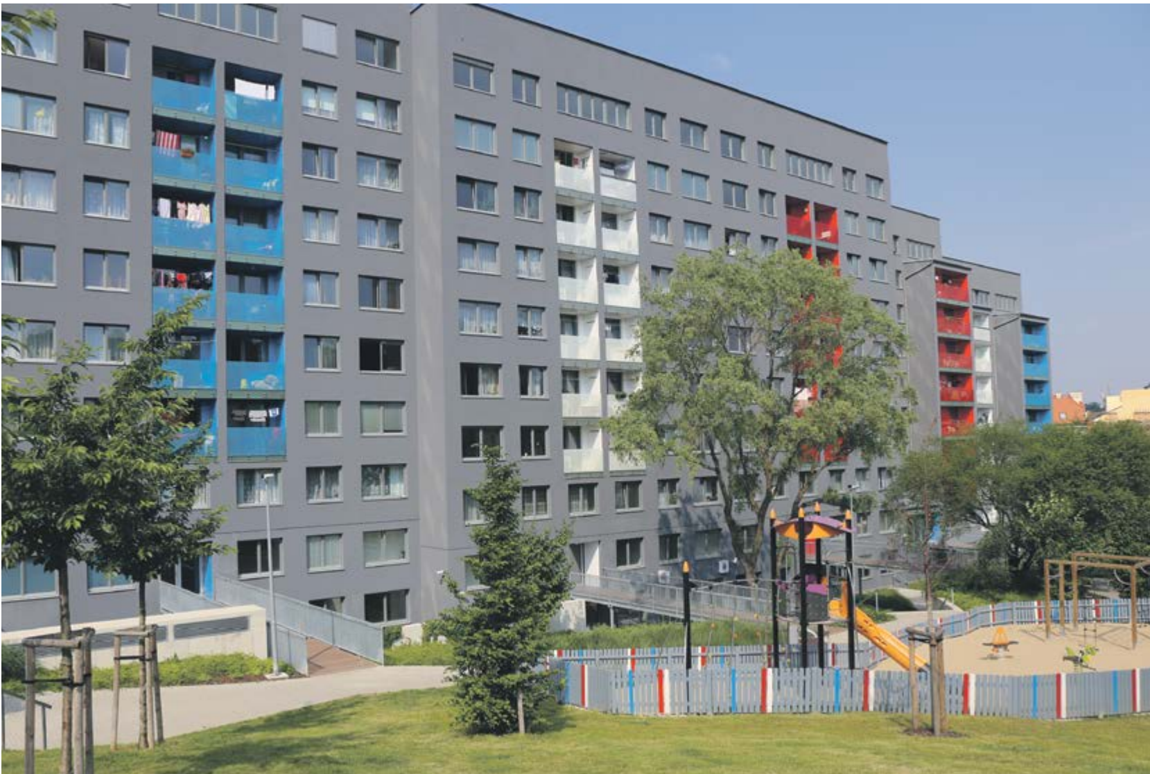
Rekonstrukce bytového domu v Lupáčově ulici vzbuzuje i po svém dokončení otázky